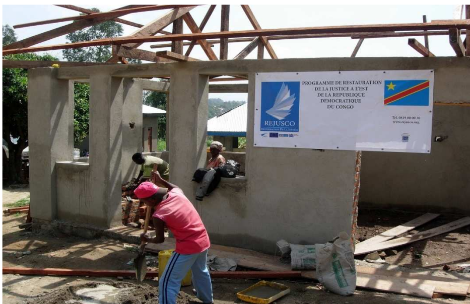
Construction du centre de détention des Procureurs Militaires de Bunia.